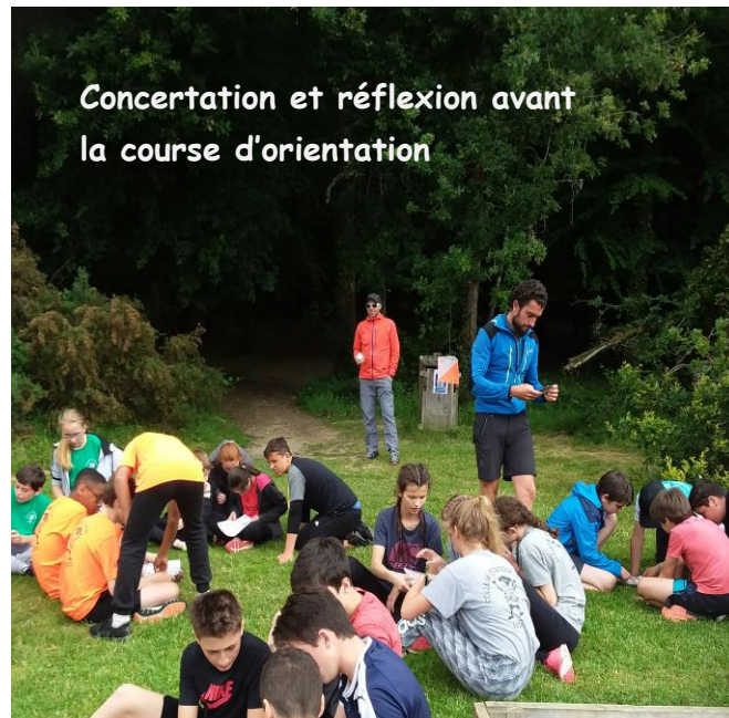
Concertation et réflexion avant la course d'orientation