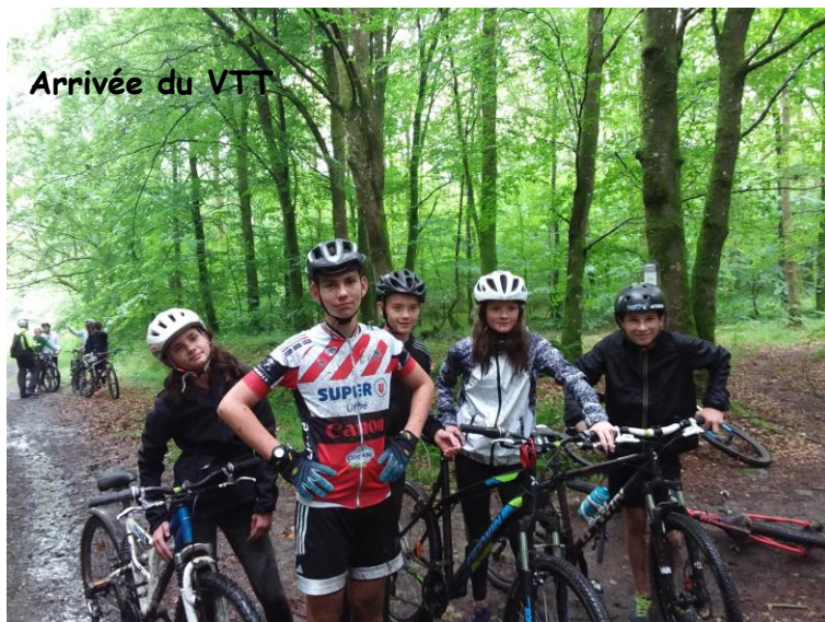
Arrivée du VTT