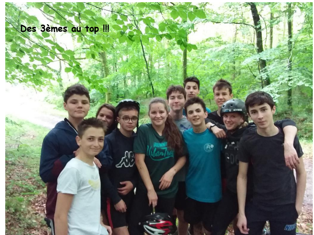
Des 3èmes au top !!!