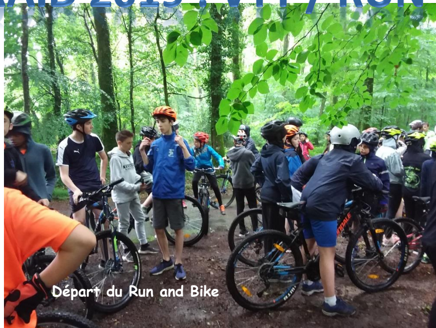
Départ du Run and Bike